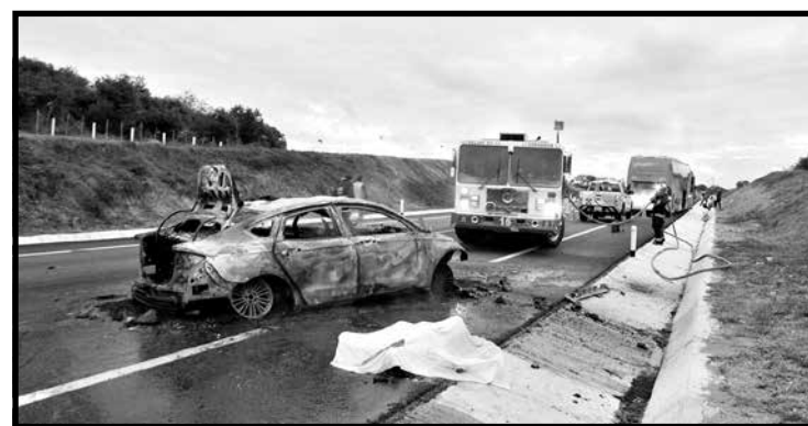
IDENTIFICADOS. Identificaron los cadáveres calcinados en accidente vehicular.