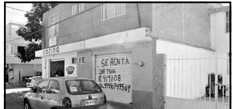
HURTO. Robo por asalto en este local en la calle Abedules en la colonia Los Fresnos. (Miguel Jaramillo-SLH)

AV. HIMNO NACIONAL No. 5440 ENTRE 5 DE MAYO Y CALZ DE GPE