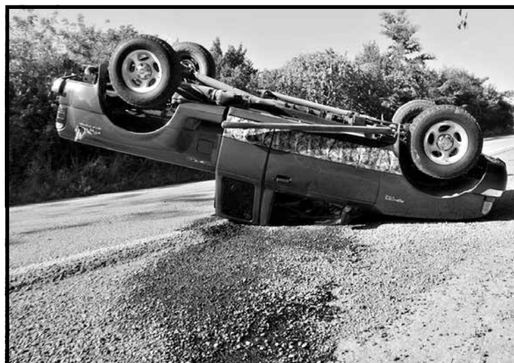
ACCIDENTE. Las dos personas sufrieron lesiones que al parecer no ponían en riesgo su vida.