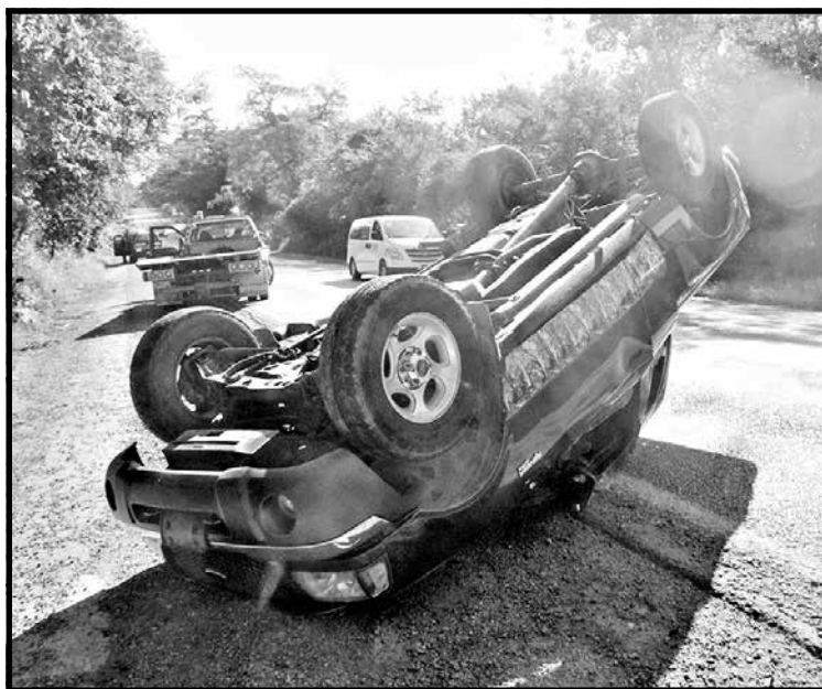
ASÍ QUEDÓ. La camioneta quedó con las llantas hacia arriba sobre la carretera Valles-Tamazunchale.

El hombre guiaba la camioneta y de desplazaba con dirección de Ciudad Valles hacia Tamazunchale, pero